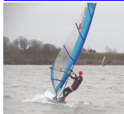
Père Noël, Mère Noël sur le Mirgenbach ??? Faut-il y croire ?

Toutes les infos : http://nauticat57.net/spip.php?article246